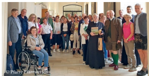
Die Pfarrwerfner Pilger-Schar im Stift Admont.